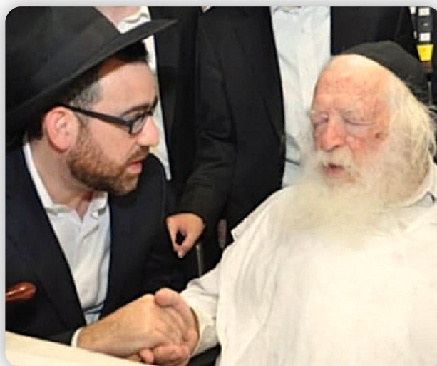
אבי מבקש ברכה למאות משפחות המודרכים על ידו